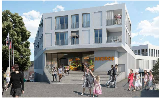
Foto rechts: Das Postareal-Gebäude in Aarberg heute (hier die Rückseite). Es wird durch den Migros-Neubau ersetzt werden (Bild oben).

dem Niveau der Altstadt eingegliedert wird. Zudem will sie einen grösseren Busbahnhof; sie forderte, dass dieser als Teil der neuen Überbauung mitgeplant wird. Wir wollten einen Supermarkt, der auch bezüglich Waren-Anlieferung und Kundenzugängen unseren Anforderungen gerecht wird.