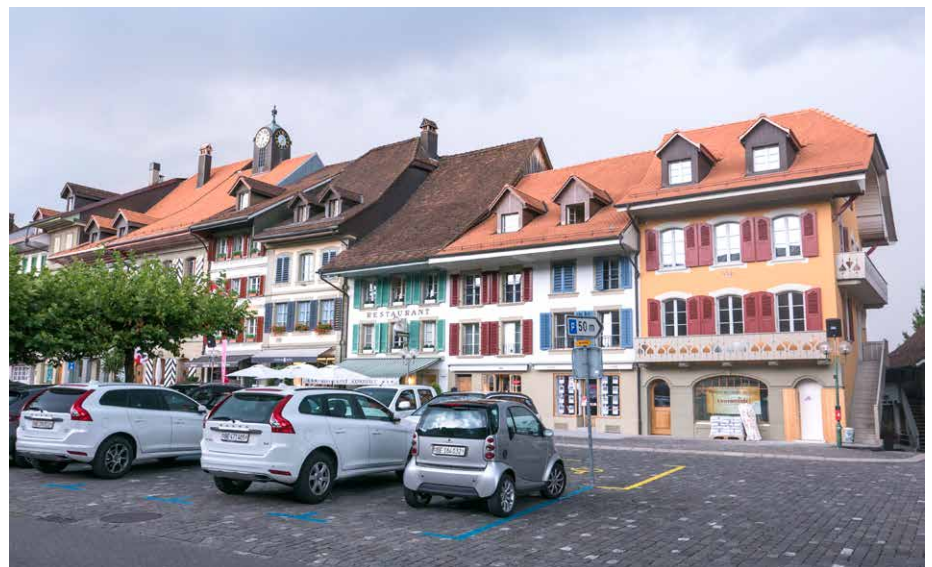
Das historische Aarberg liegt auf einem Hügel. Eine steile Treppe führt vom Coop Aarberg Center hinauf zur Altstadt (Foto oben). Der Weg von der künftigen Migros aus wird via Falkenbrücke (rechts oben) in die ISOS-geschützte Altstadt führen. Foto rechts: Der Stadtplatz mit Parkplätzen.

ihrer Stadtanalyse. Zudem liesse sich zugleich ein anderes Problem der Gemeinde lösen: Der zu eng gewordene Postauto-Bahnhof vor dem Postgebäude könnte neu konzipiert werden.