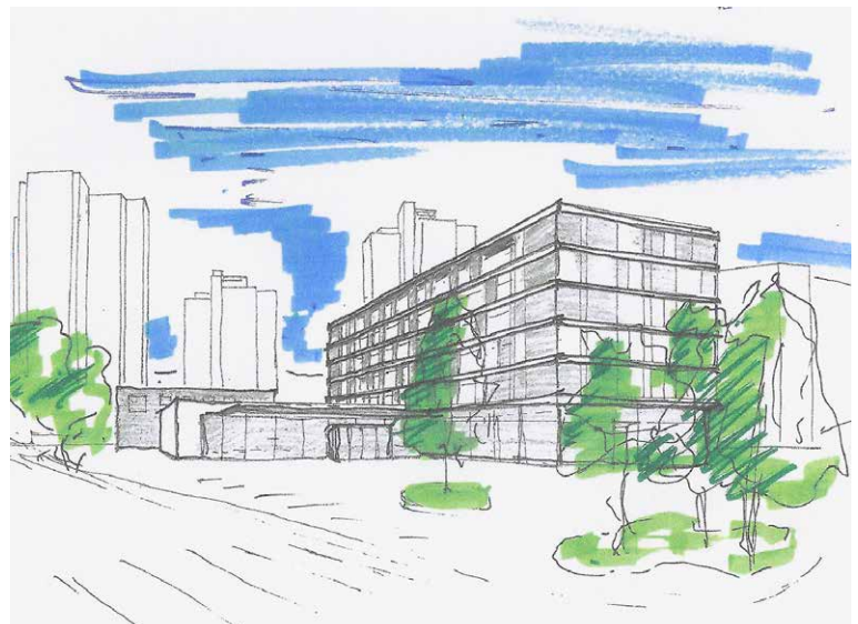
In Hinterkappelen BE wird die Migros Aare ihren einstöckigen Supermarkt «Chappellemärit» durch einen 6-geschossigen Neubau mit Wohnungen ersetzen. Illustration: MAG.

Interview: Annemarie Straumann, VLP-ASPAN