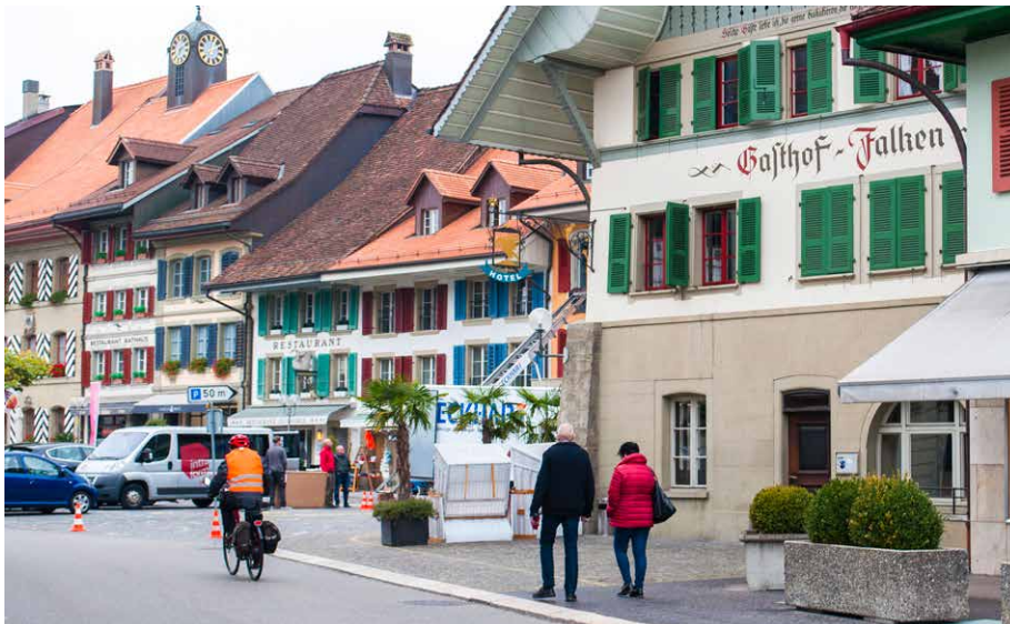
Wer aus der künftigen Migros tritt, wird in wenigen Schritten in die Altstadt gelangen.

Ortsrand zu wachsen und hat das entsprechende Gebiet rechtskonform eingezont. Die Migros will dort präsent sein, wo sich die Kundenströme bewegen und wo wir ein echtes Bedürfnis für unsere Angebote ermitteln. Es muss eine Win-win-Situation für die Migros und die Gemeinde entstehen.