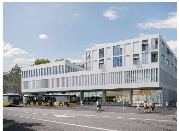
Das Postgebäude mit dem Busbahnhof heute (links), und der an gleicher Stelle geplante Migros-Neubau (rechts oben). Illustration: Swiss Interactive AG